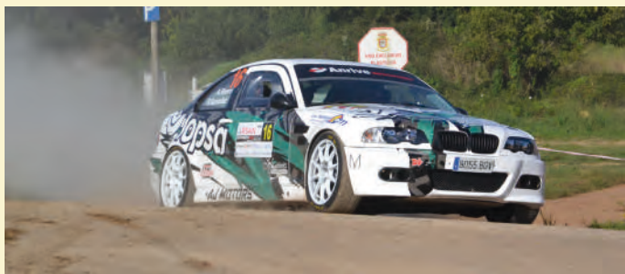
5 Ángel Rivero