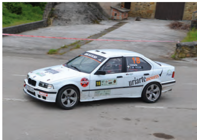
14 Igor Uriarte