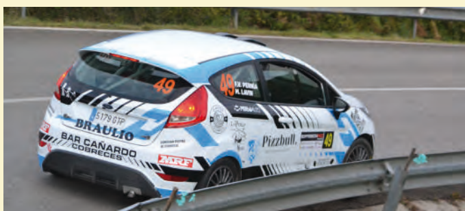
24 Fidel Valdes