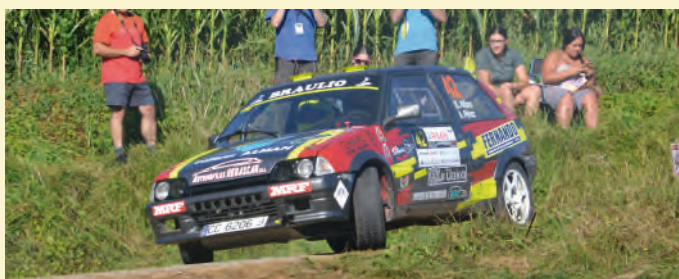
33 Borja Alfaro