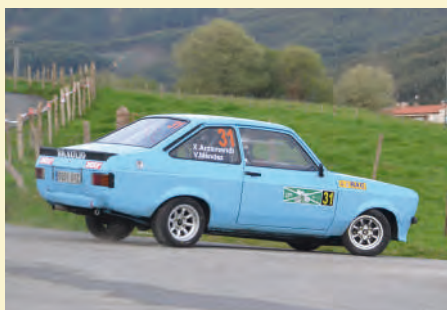
37 Xabier Arzamendi