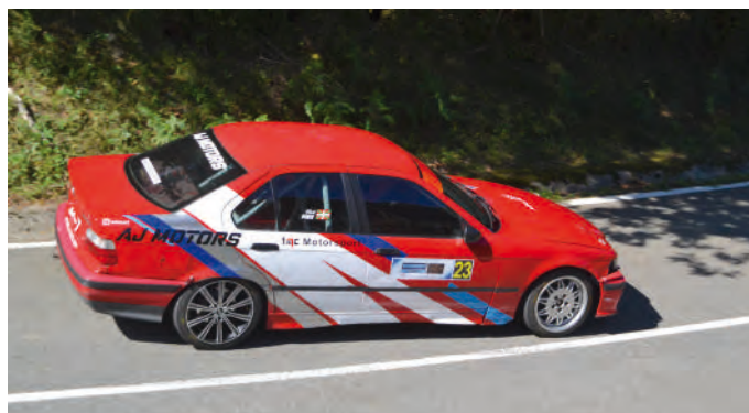
10. Ebert Piriz