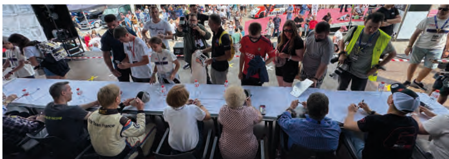
La firma de autógrafos es uno de los momentos míticos de la prueba

Estos podrían ser algunos de los aspectos por lo que hay que apoyar a esta prueba para que tenga continuidad, pero hay más. El retorno económico para la región es muy importante, y aunque no hay cálculos oficiales de cuanto público estuvo presenciando la prueba, la cifra superó a la de ediciones anteriores, dejando una importante inyección económica en la región. Hoteles, casas rurales, supermercados, gasolineras, bares o restaurantes de la zona, seguro que lo notaron.