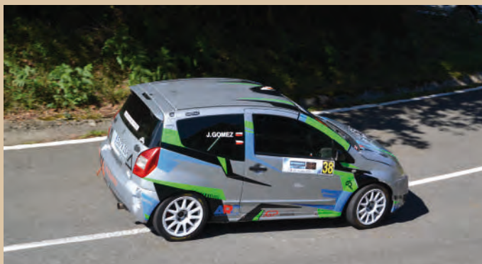
43 Julio Gómez