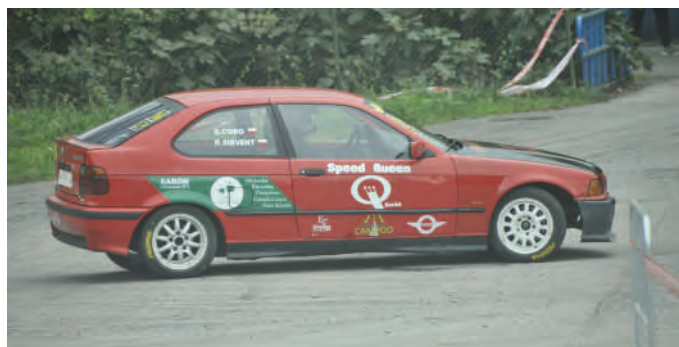
14 Pedro Sirvent