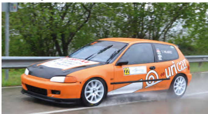
9. Imanol Hilario