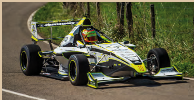
4 Javier Polanco