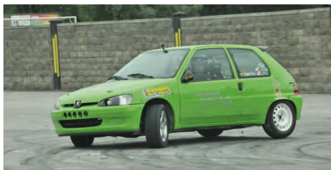
16 Angel Rios