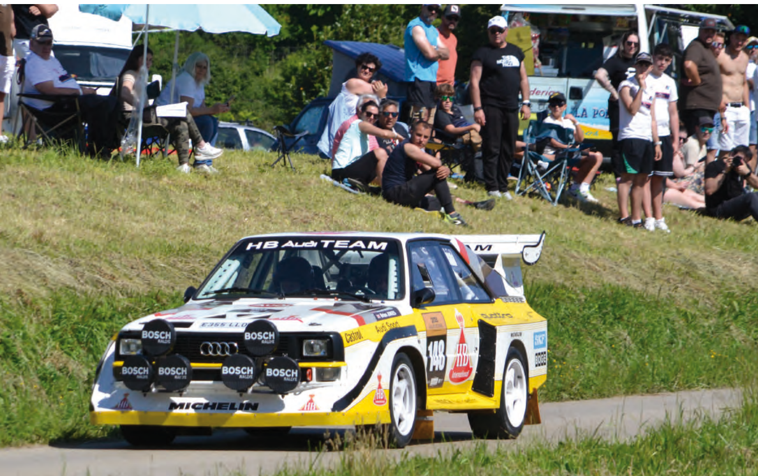
Ver por las carreteras de Cantabria a los Audi Quattro S1, es todo un lujo