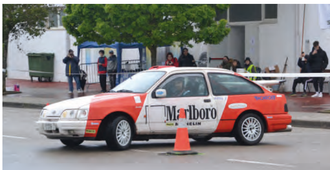
25 Pablo Gonzalez