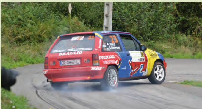
25 Sergio Madrazo