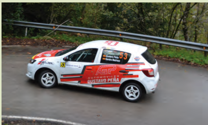
39 Gustavo Peña