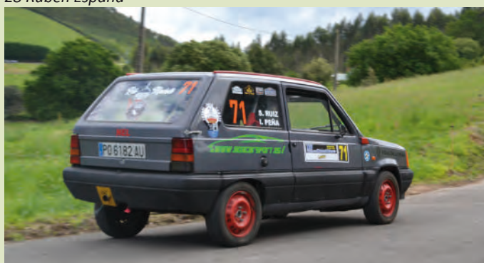
30 Ismael Peña

belga Nicola Stampart, se clasificaba en la cuarta plaza, mientras que Félix Macías completaba las cinco primeras posiciones. Una prueba en la que además de la clasificación general también se disputaban varios apartados dependiendo del modelo del vehículo. La más emocionante fue la reser-