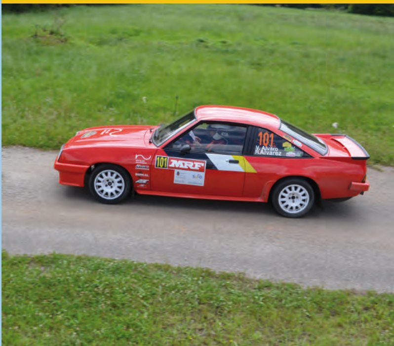
1 Victor Álvaro