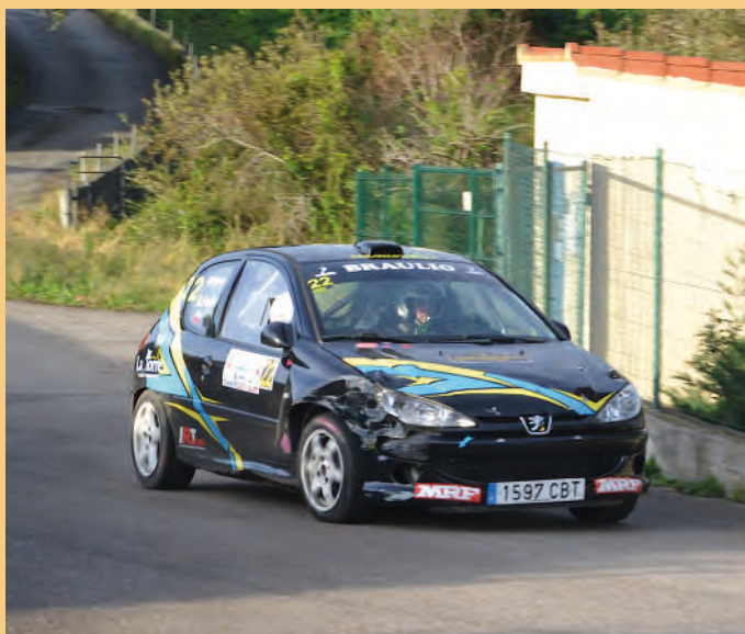
5 Rubén Pardo