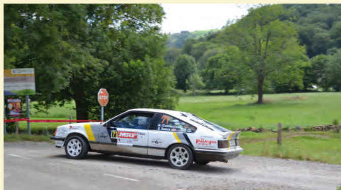
50 Alfredo Cacicedo