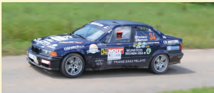
9 Pablo Pacheco