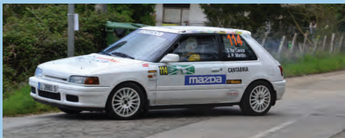
2. Serafin Vaz