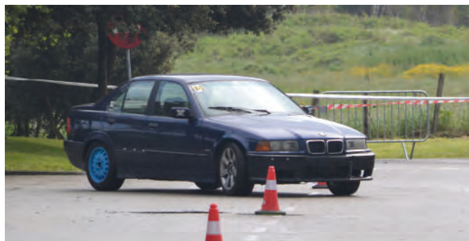
20 Eder Vicente