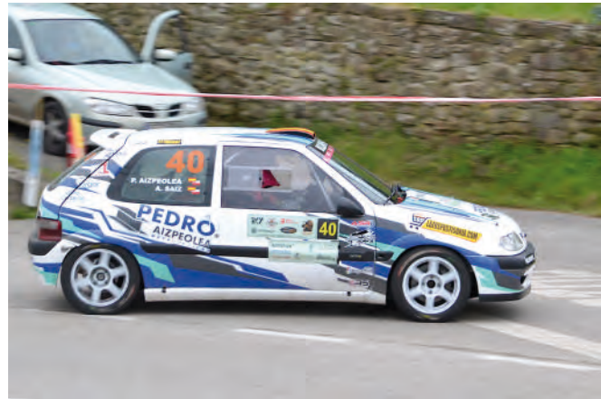
10 Pablo Aizpeolea