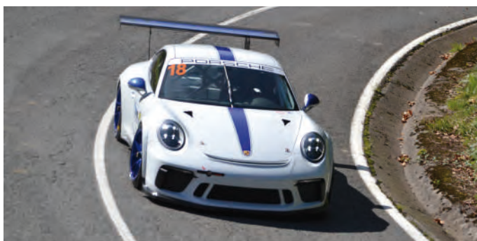
7. Cándido Vargas