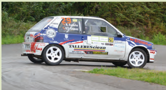
28 Ruben España