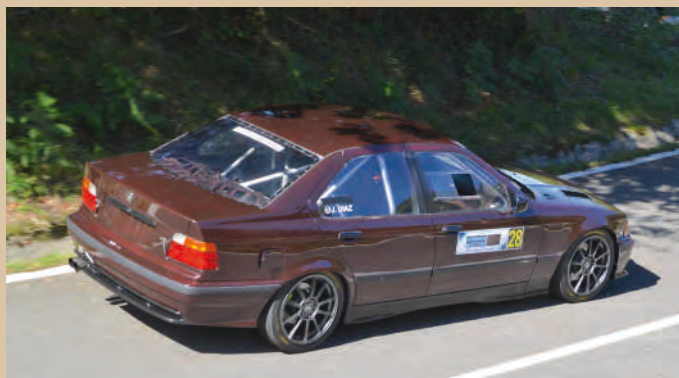
30 Jagoba Diaz