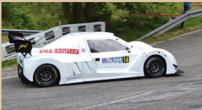
9 Ruben Echevarria