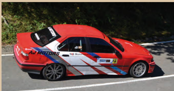
22 Ebert Piriz