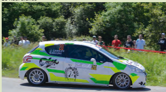
22 Jorge Canales