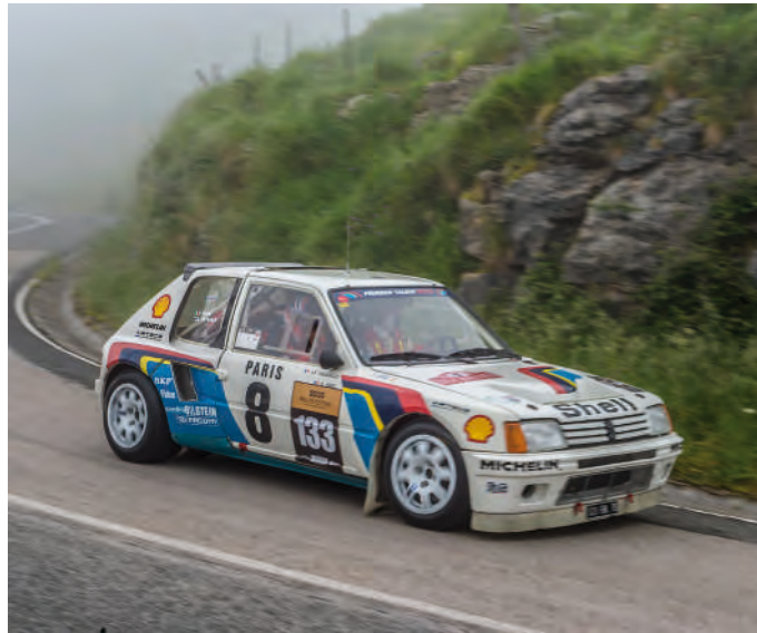
Ari Vartanen con el Peugeot 205 Turbo 16 en la especial de Alisas