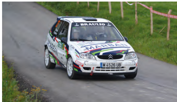
10 Eduardo Perojo