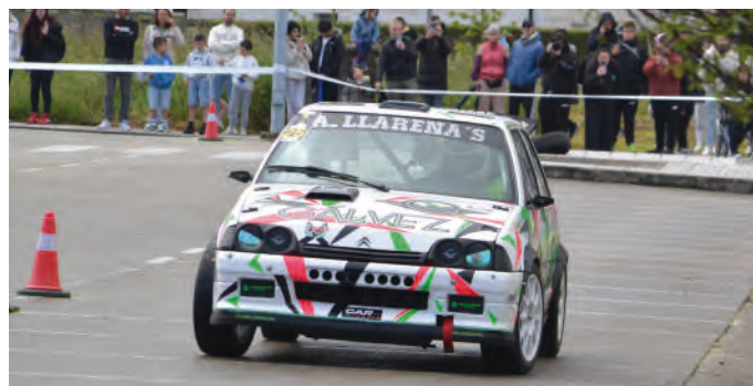
4 Aitor LLarena Gonzalvez