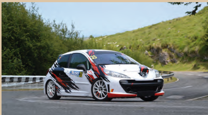
37 Alberto Sobrino