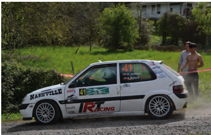
11. Raúl Jimenez