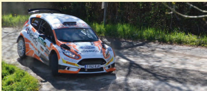
3 Dani Peña