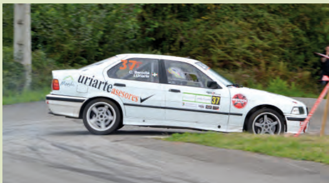
19 Igor Uriarte