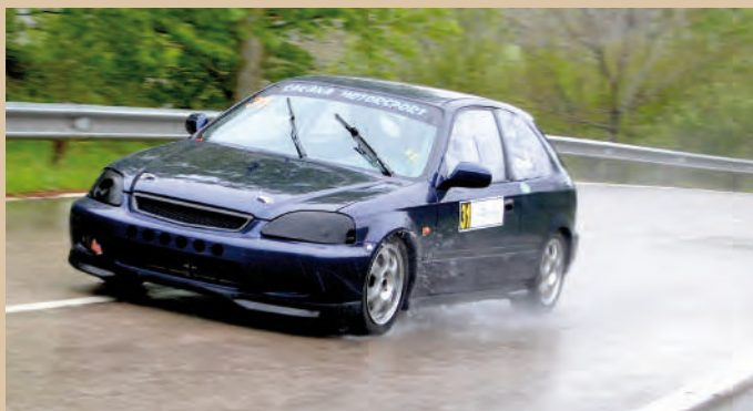
31 Israel Conde