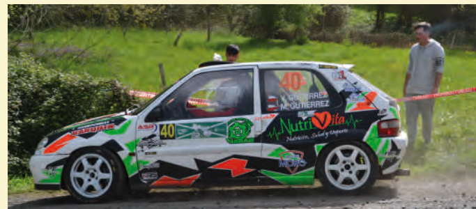
12 Javier Gutiérrez