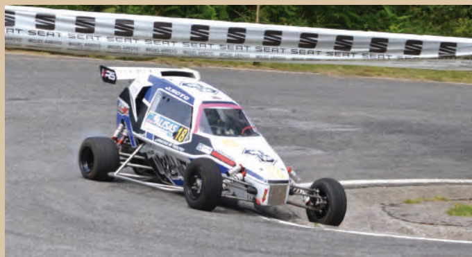
12 Javier Soto