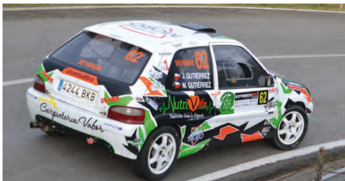
1 Javier Gutierrez