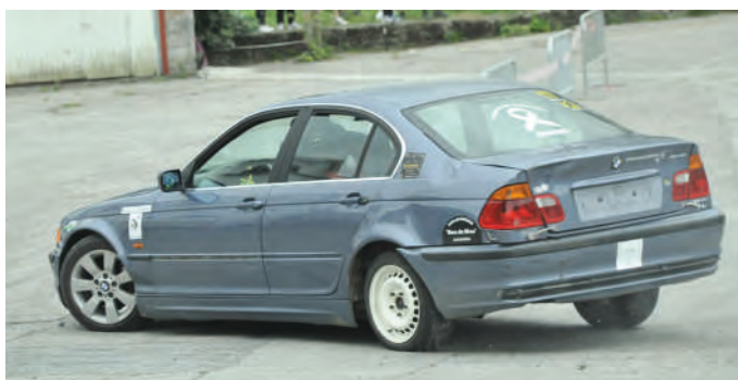
39 Raul Pérez