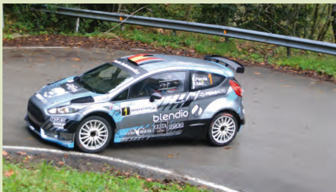
1 Surhayen Pernia