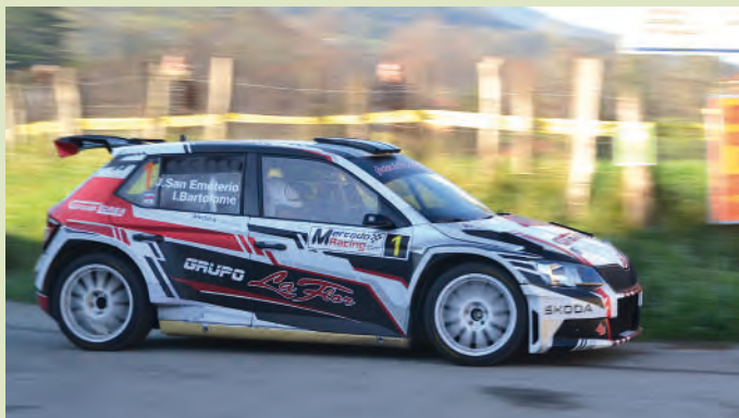
3 Jaime San Emeterio