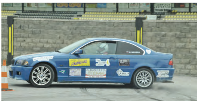
29 Unai Barrio