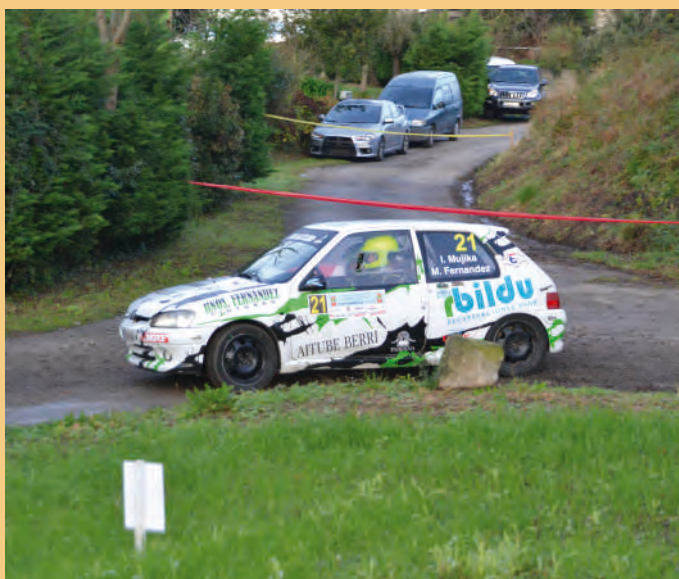
7 Ibai Mujika