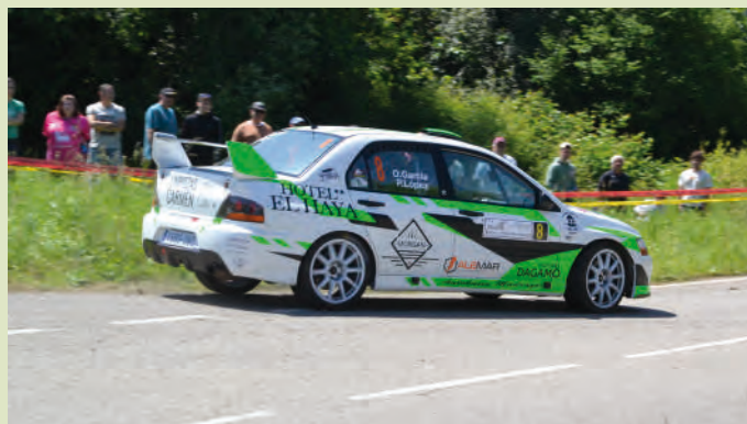
14 Oliver García