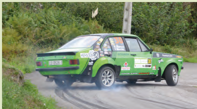
20 Raúl Blanco