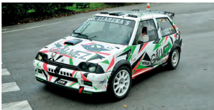
1 Aitor Llerena