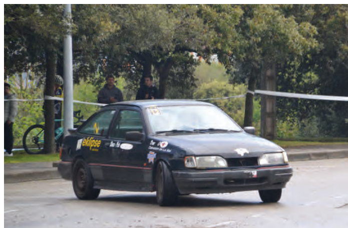
23 Borja Puente