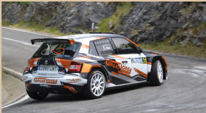
27 Izarne Osa