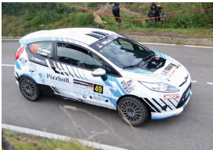
13 Fidel Valdes