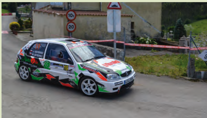
9 Javier Gutierrez