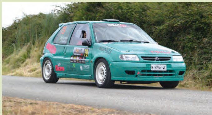
26 Álvaro Calera