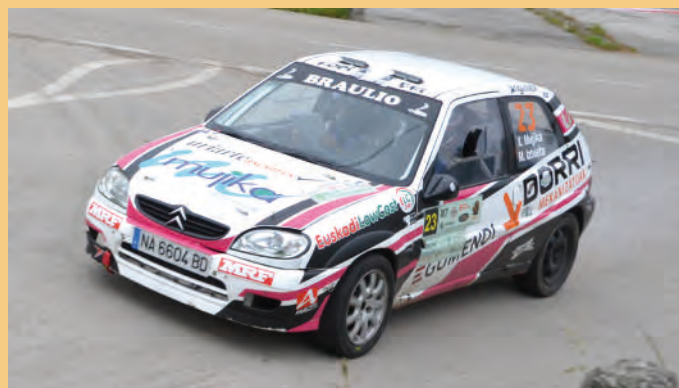
2 Xabier Mugica