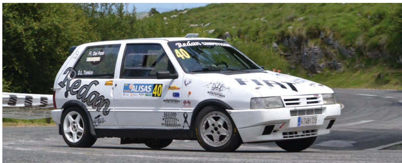
27. Rebeca Del Pozo