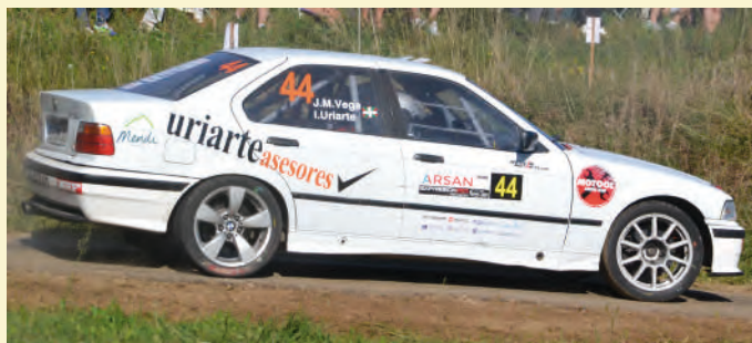
30 Igor Uriarte