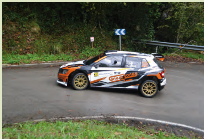
46 Izarne Osa