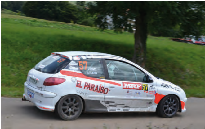
6 Jairo Gómez