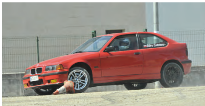
36 Jairo Cabrero