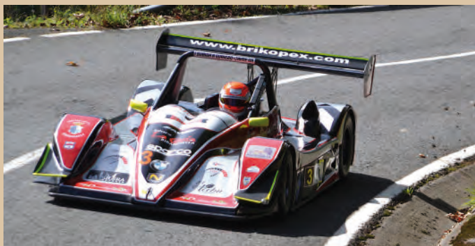
3 Jairo Pesquera