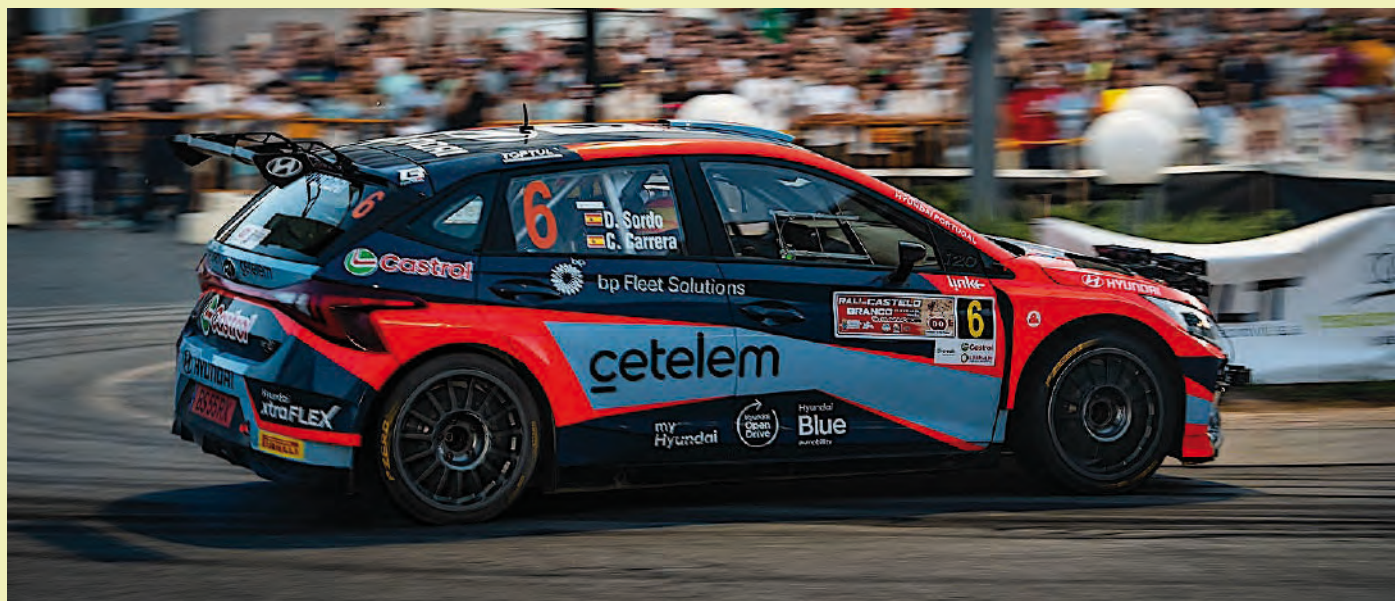
Dani Sordo con el Hyundai ganador del certamen portugués.

A pesar de no participar durante el 2025 en ninguna prueba del WRC y en las últimas temporadas no disputar al completo dicho certamen, Dani Sordo sigue dándonos alegrías. Si en el 2024 lograba la victoria en la Subida a Pikes Peak en Colorado (EE. UU), en el 2025 lograba el título en el Campeonato de Portugal de Rallies