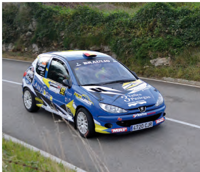
20 Gregori Sosa