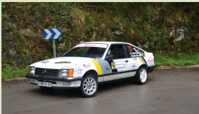
35 Alfredo Cacicedo