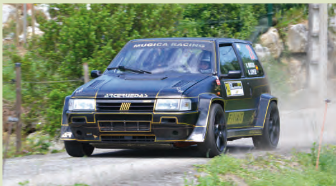
23 Sem Mugica