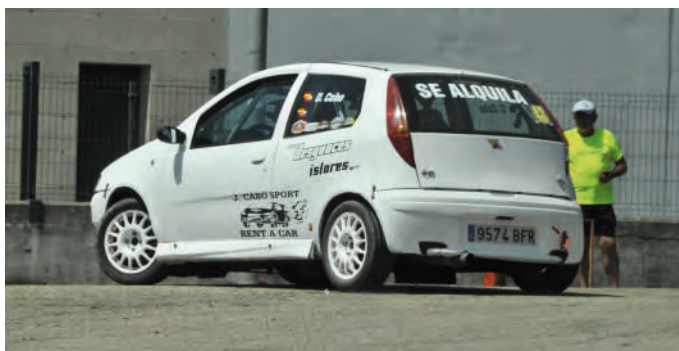
35 Dario Cabo