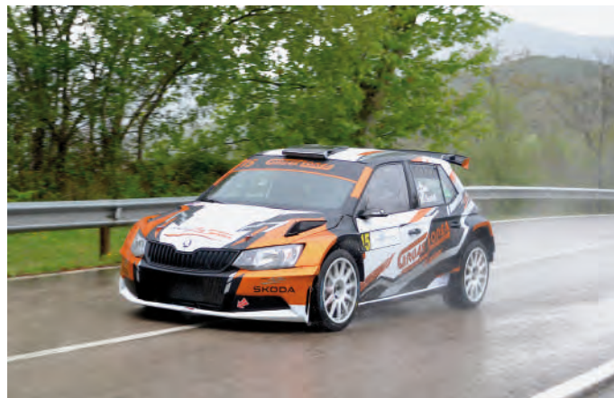
12. Izarne Osa