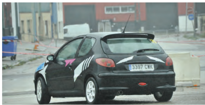
42 Santiago Cobo