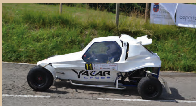
14 Jacobo España