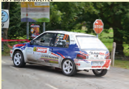
46 Ruben España