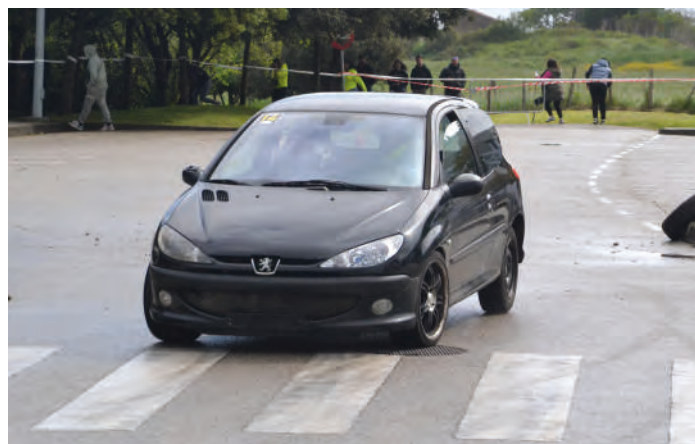
22 Álvaro Pascual