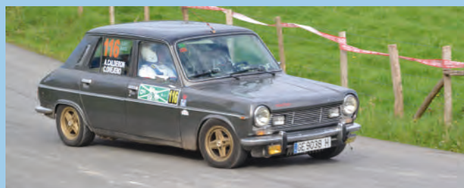
5. Alejandro Calderón