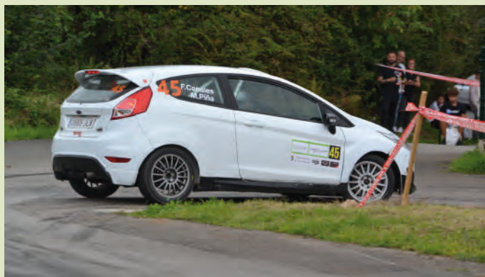
36 Fidel Canales