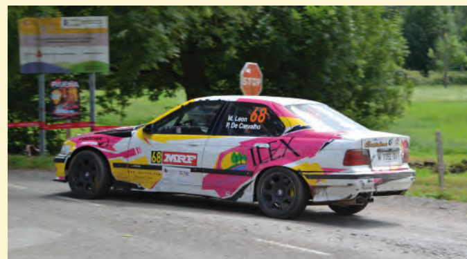
54 Marcos León

cross, Abel Gonzalez, que además de terminar su primer rally, estuvo marcando unos buenos tiempos durante toda la jornada y demostrando una rápida adaptación a la especialidad de rallies a sus 16 años.