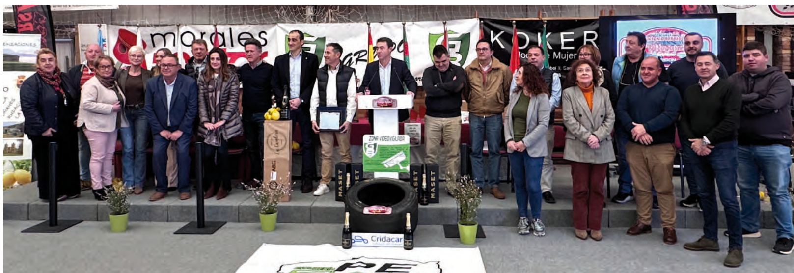
Foto de familia de organizadores y patrocinadores tras el acto de inauguración