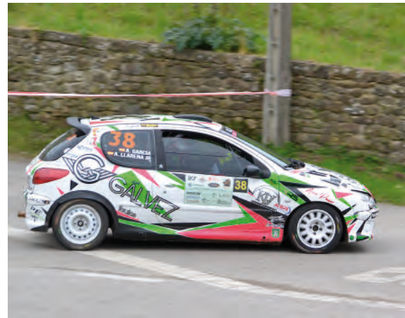
5 Aitor Llerena