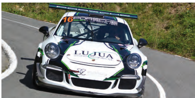
3. Xabier Lujua