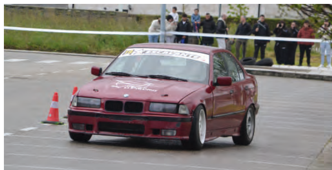
28 Urko Guilarte