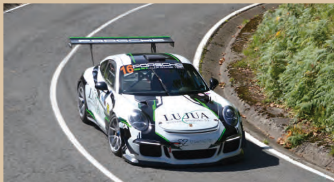
10 Xavier Lujua