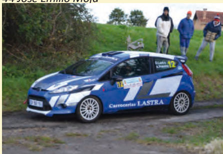
47 Óscar Lastra