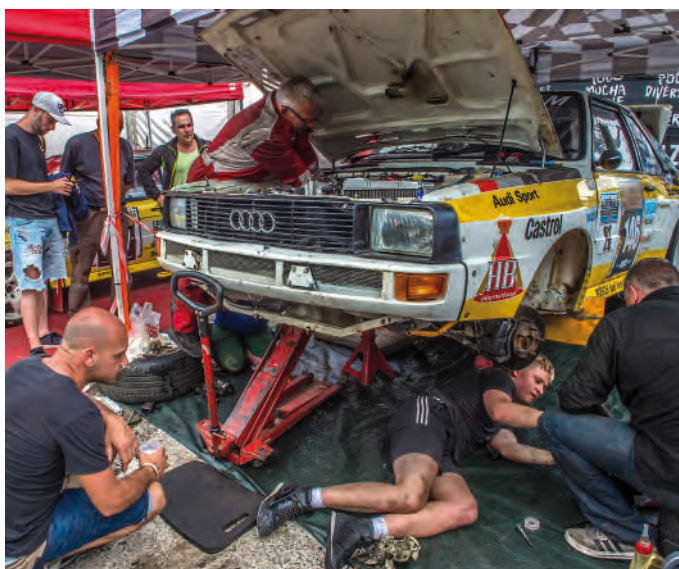
En el parque de asistencia se pueden revivir aquellas míticas asistencias en los rallies de los 80